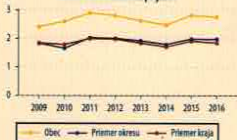
Miera sebačastičnosti príjmov

Schopnosť finančného krytia majetku má vysoký význam pre trvalo udržateľný rozvoj. Celkovo bonitné ukazovatele charakterizujú možnosti a schopnosti zabezpečenia zdrojov pre rozvoj základných a inovačných aktivít.