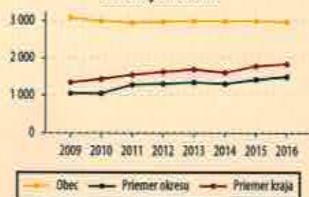
Čistá majetková sila

Prí hodnotení bonity obce bol kladený dôraz na schopnosť obce efektívne využívať majetok na riadenie príjmovej politiky prostredníctvom príjmového efektu z majetku, bola vyhodnotená majetková sila a ďalšie ukazovatele charakterizujúce efektívnosť nakladania s majetkom. Výsledky tohto hodnotenia charakterizovali majetkovú bonitu.